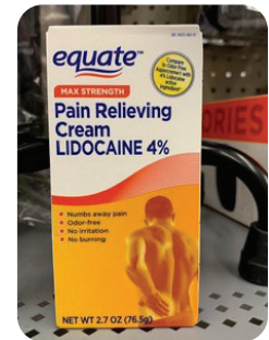
Equate (marca de Walmart)

Para obtener información sobre cómo ponerle la crema de lidocaína a su hijo, escanee los códigos QR o use los enlaces: