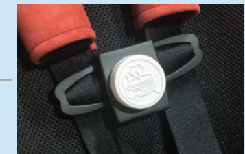
Protector de cierre de retención para asiento de automóvil Spirit