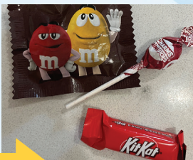
Luego ¡Una recompensa!