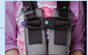
Protector de cierre para el pecho Merritt