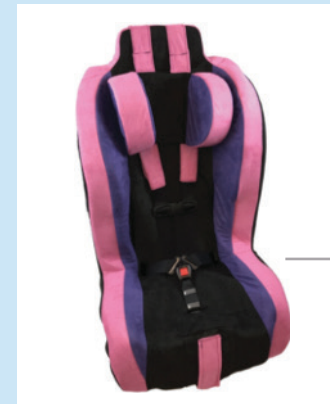
Asiento para automóvil Merritt Roosevelt con productos a prueba de fuga

Para 35 a 115 libras; 33.5 a 62 pulgadas