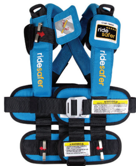
Chaleco ajustable con cremallera y presillas