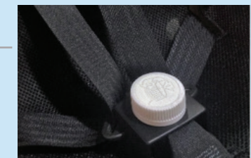
Protector de hebilla para asiento de automóvil Spirit