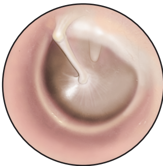
Membrana timpánica normal