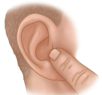
Pumping the tragus