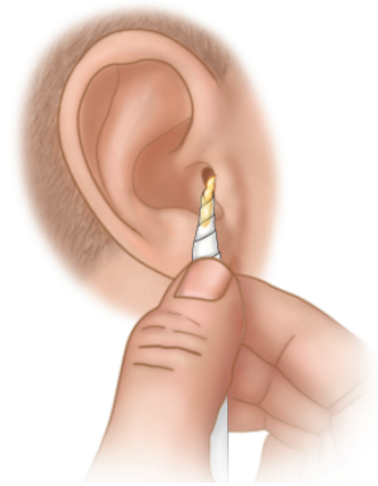
Absorción en el oído para eliminar la secreción